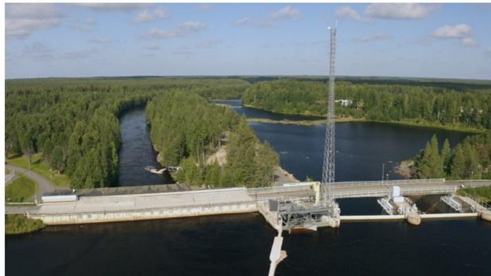
Kuva 3. Pohjois-Pohjanmaan liitto. Iijoen Haapakoskelle on rakennettu Suomen ensimmäinen smolttien alasvaellusreitti.